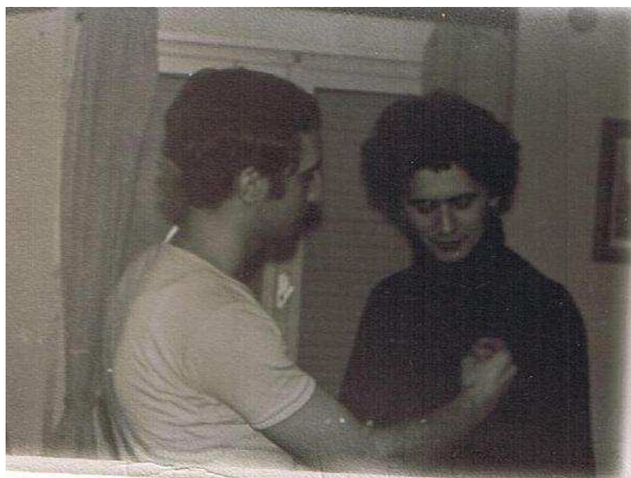
Wir Bâcă Panda primind emoționat însemnele Panda Wira