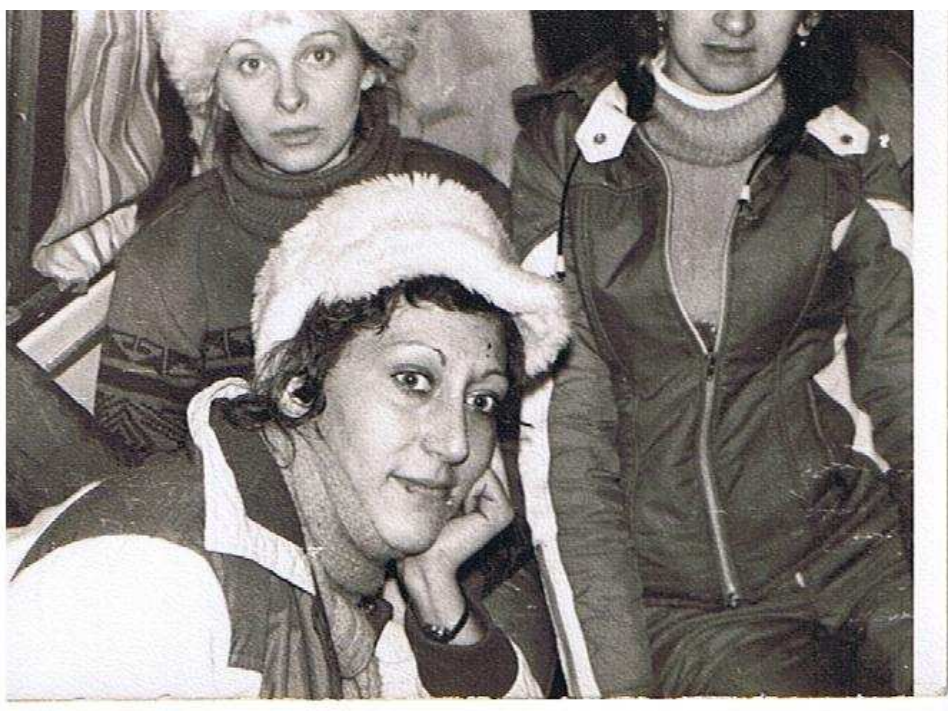
Începutul nopții glaciare ne-a găsit bine dispuși

Din când în când mă uitam la ceas și mă minunam că nu trecuseră decât câteva minute de la precedenta consultare a orologiului. Totuși, oricât de încet trecea timpul, în cele din urmă cadranul ceasului îmi arăta ceea ce voiam să văd de mult timp: 11:55 PM.