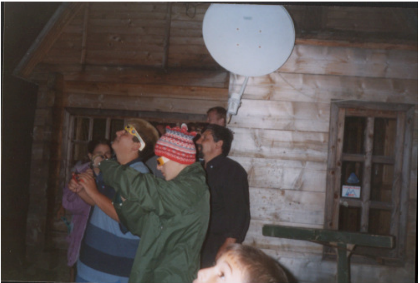
11 August 1999 cabana "Iepurasul" Muntele Mic