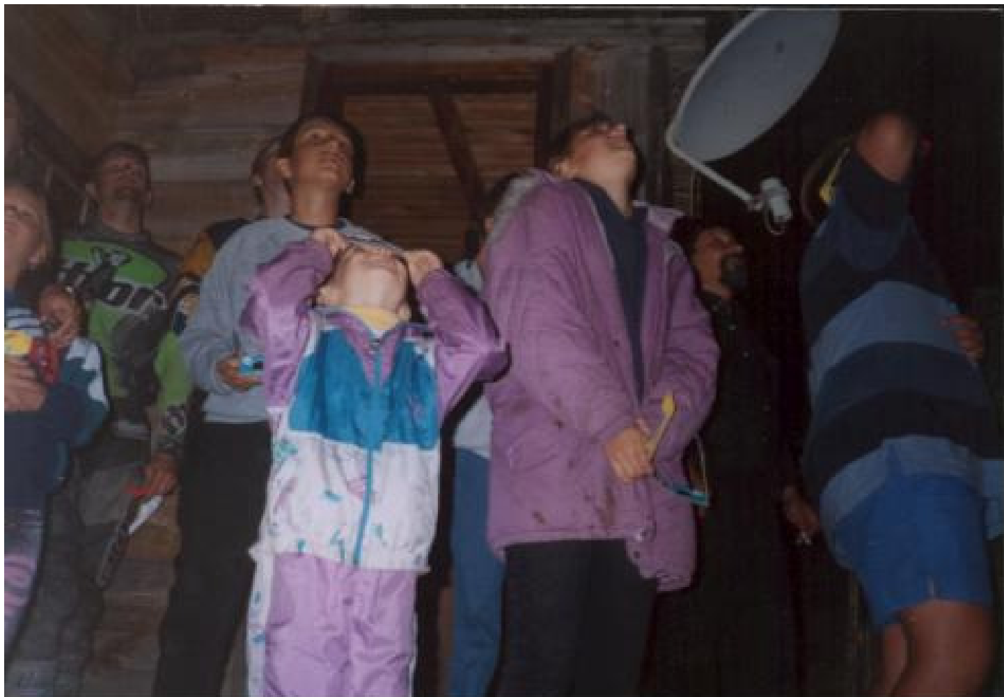
11 August 1999 cabana "Iepurasul" Muntele Mic

In viata mea n-am mai vazut asa ceva...!